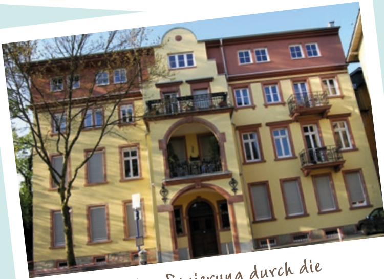
... und nach der Sanierung durch die Hochtaunusbau.