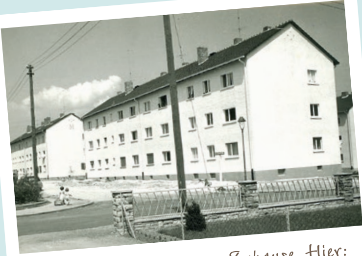
Auf dem Weg in ein neues Zuhause. Hier: Georg-Schudt-Straße 1-3; 50er Jahre.

gaben.“ Wie das Zitat vermuten lässt, fehlten für den tatsächlichen Baubeginn sowohl die finanziellen Mittel als auch Baumaterial. Zur Verdeutlichung, mit welchen Schwierigkeiten die Bevölkerung und somit auch die damaligen Gründer kämpften: Für einen Quadratmeter Dachpappe musste man ein Kilo Lumpen oder zwei Kilo Altpapier bei der Kreisstelle für Bauwirtschaft abgeben. Material für ein ganzes Haus zu beschaffen, war eine schier unlösbare Aufgabe.