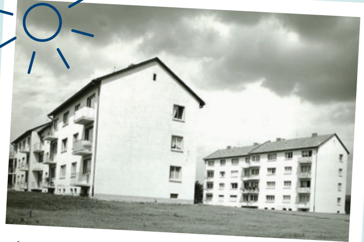
Der Reinerzer Weg 10 in den 50er Jahren