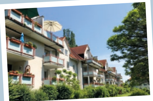
Gute Aussichten: Rückseite der Hessenring-Liegenschaften 96a-98b

zusätzlich ein umfangreiches Modernisierungsprogramm mit Wärmedämmmaßnahmen und Fassadenerneuerungen an den Häusern der 50er Jahre.