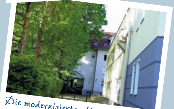
Die modernisierten Häuser im Bad Homburger Hessenring

Doch wie in der Genossenschaft üblich, lag der Fokus nicht nur auf den Neubauten. Auch um den Erhalt und die Modernisierung der Bestände wurde sich gekümmert. So begann 1996