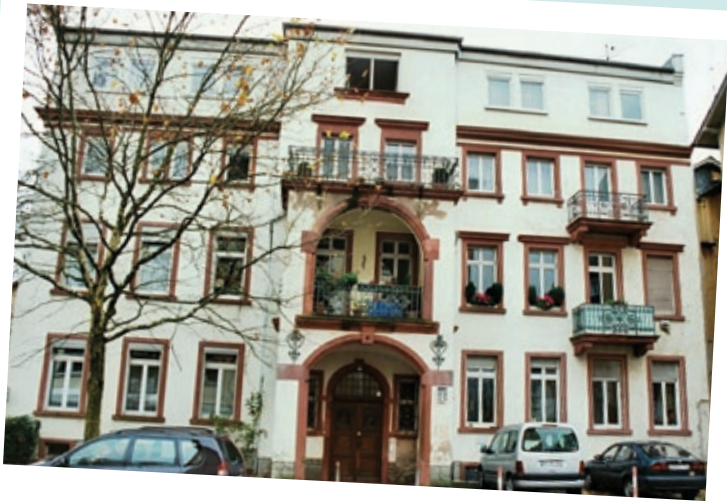
Frankfurter Straße 8 vor ...