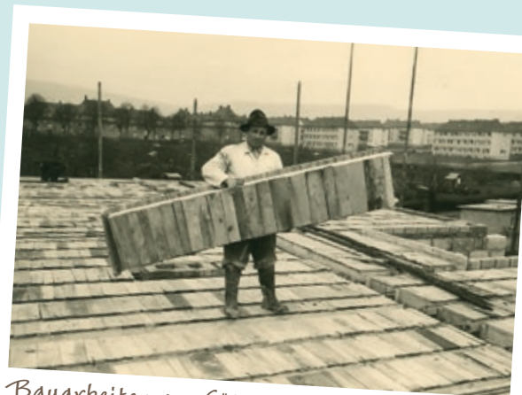
Bauarbeiten am Götzenmühlweg 51–57 im Jahr 1956.

Das erste Projekt ging die „Selbsthilfe“ im Güldensöllerweg, am sogenannten „Hegewäldchen“, an. Voll Enthusiasmus wurden Baugruben ausgehoben, Bäume für Dachstühle gefällt und Bruchsteine angefahren. Konrad Riedel